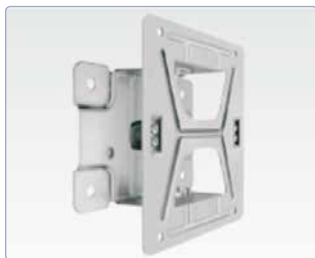
Zubehör: lackierte Schwenkplatte