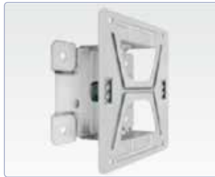
Zubehör: lackierte Schwenkplatte