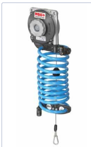
Seulement pour les types 630-632